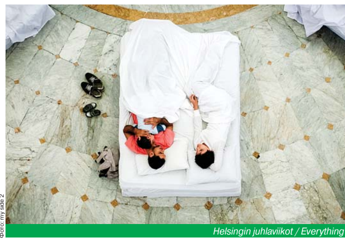
Helsingin juhlaviikot / Everything