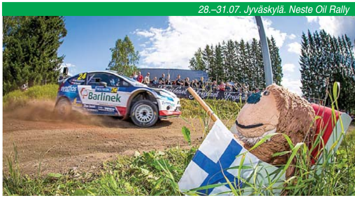
28.–31.07. Jyväskylä. Neste Oil Rally

Tampere Чемпионат мира по поеданию перца чили Правила довольно просты: за 30 минут нужно съесть как можно больше перцев сорта Naga Morich (на минутку, в рейтинге остроты занимает 11-е место, это бангладешский чили) – результат меряют в граммах. Участник прекращает соревнование в тот момент, когда он пытается съесть что-нибудь другое вместо чили или ему становится плохо. В этом году параллельно будет проходить Gringo Bandito Taco Challenge, то есть конкурс на лучше-