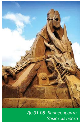
До 31.08. Лаппеенранта. Замок из песка

До 31.08. Лаппеенранта Замок из песка Песочный замок традиционно открыт в крепости «Линнойтуус». Тема песочного замка этого года – «Рыцарский замок»! Из трех миллионов килограммов песка созданы скульптуры принцессы, принцев, королевских особ и рыцарей, а также скульптурные композиции рыцарских турниров. В этом году