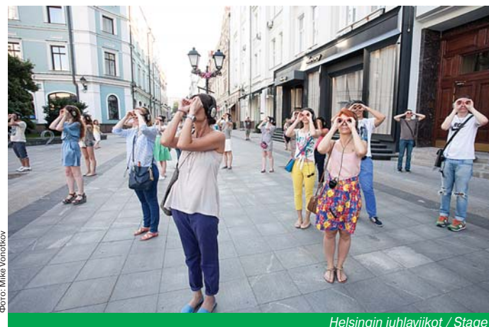
Helsingin juhlaviikot / Stage