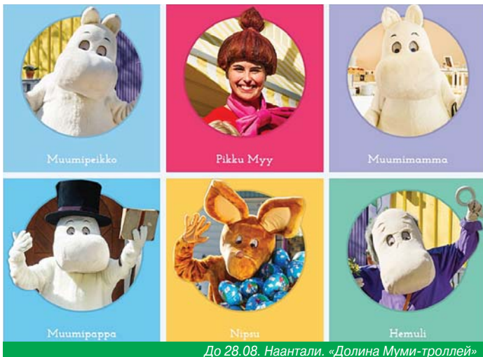
До 28.08. Наантали. «Долина Муми-троллей»

До 09.08. Турку Остров приключений Väski Väski – это остров приключений, рассчитанный на детей примерно младшего школьного возраста. Здесь летний день пролетит мигом! Маршрут приключенческой игры заставит детей проверить свои физические и умственные навыки. При выполнении заданий лазают, спускаются по канату, стреляют из лука, намывают золото и делают все такое, чего дома попробовать невозможно. Остров Väski – это настоящая жизнь на природе. Здесь нет ни электричества, ни холодильников, ни водопровода, ни микроволновок. Но это не мешает наслаждаться жизнью! Туалеты находятся на