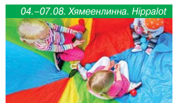
04.–07.08. Хямеенлинна. Hippalot

Из Хельсинки до Хювинкья можно доехать на пригородном электропоезде, он курсирует два раза в час. Поездка занимает около 40 минут и стоит около 10 евро.