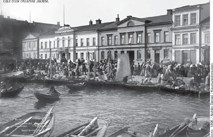
Фото: 1895 / Nyolin Daniel / Kaupunginmuseo