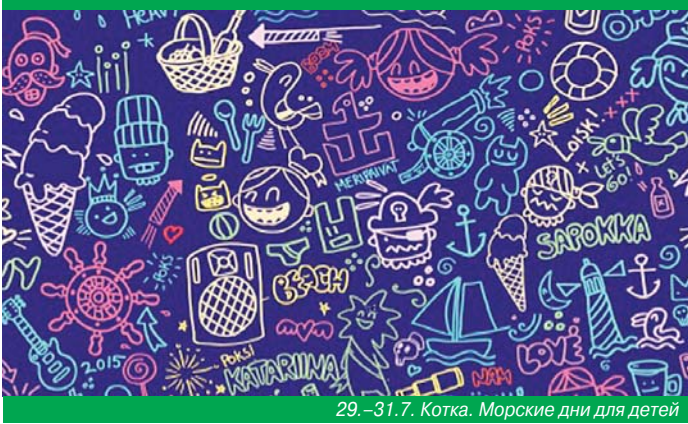
29.–31.7. Котка. Морские дни для детей

Кангасала Löytöretki – Lasten kesäpäivät Летние денки для детей могут превратиться в экспедицию по неведомым тропам Кангасала.