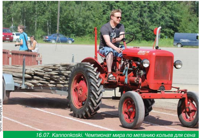
16.07. Kannonkoski. Чемпионат мира по метанию кольев для сена

Чемпионат мира по болотному футболу является отличным местом приятно, совмещенного со спортом, времяпровождения для предпринимателей и заинтересованных сторон. В чемпионате принимают участие игроки из 30 разных стран, и атмосфера соревнования – это незабываемый опыт. Соревнование в бизнес-лиге будет проходить между 16 командами.