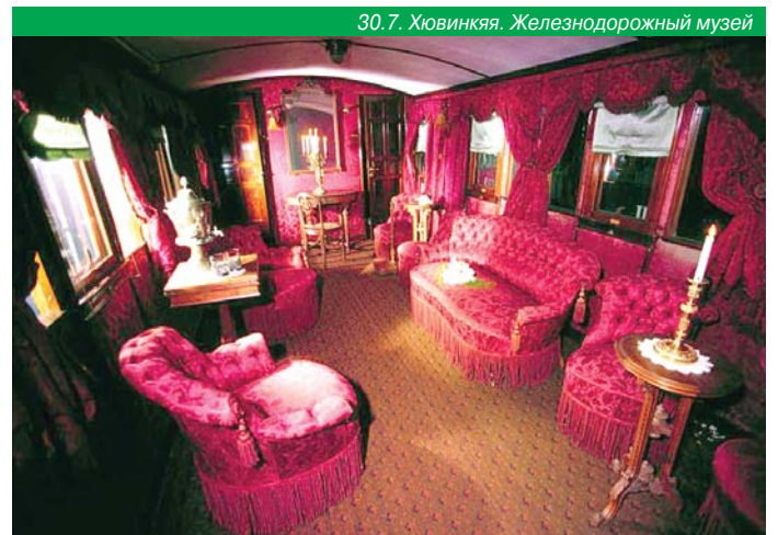
30.7. Хювинкья. Железнодорожный музей

Хельсинки Технический музей Хельсинки Музей техники – единственный универсальный технический музей в Финляндии.